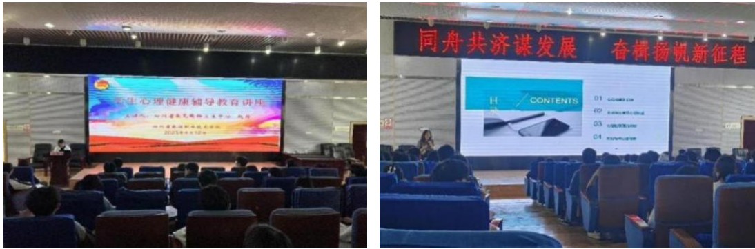
学生心理健康培训

5.加强安全治理，防范校园安全风险。完善学校“人防、物防、技防”建设，坚持日排查、周巡查和月报告制度，着力构建全员参与、责任共担、协同治理的“大安全”工作格局，全力做好防火、防溺水、防性侵、防电信诈骗等工作。紧盯开学、期末、节假日放假等重要时间节点，配合公安、教育、市场监督等相关部门开展校园安全隐患排查，经常性开展自查自纠，整改风险隐患。学期执行领导带班检查 20 次，排查出事故隐患 15 处，查出逐一督促完成整改。在全体职工上下共同努力下，学校安全工作取得长足进展，实现了师生安全事故零发生的目标，确保了校园平安建设持续稳定。