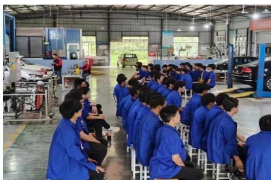
汽车维修保养赛项现场