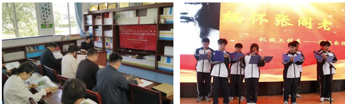
举行纪念张澜先生诞辰152周年主题教育