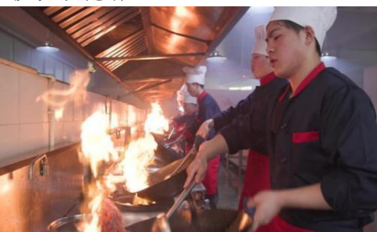
中餐烹饪赛项现场