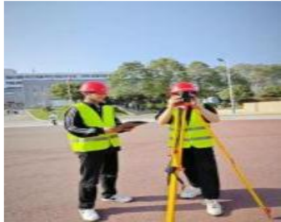
工程测量赛项现场