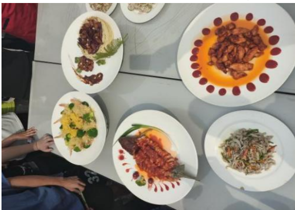
学生中餐烹饪作品