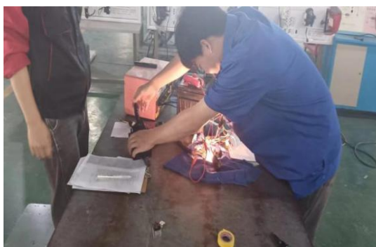
汽车机电维修赛项现场